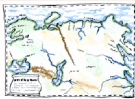
Географическая карта Петрушки

Петр. Служи верно, кому присягнешь; слушайся начальников, их лаской не гоняйся; на службу не напрашивайся; от службы не отговаривайся; и помни пословицу: береги платье снову, а честь с молодцу. Матушка в слезах наказывала мне беречь мое здоровье, а Савельичу смотреть за дитятей. Надели на меня заячий тулуп, а сверху лисью шубу. Я сел в кибитку с Савельичем, и отправился в дорогу, обливаясь слезами.